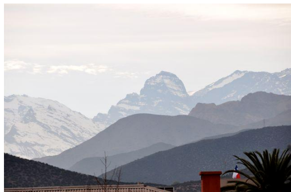
Blick von der Schule in die Anden