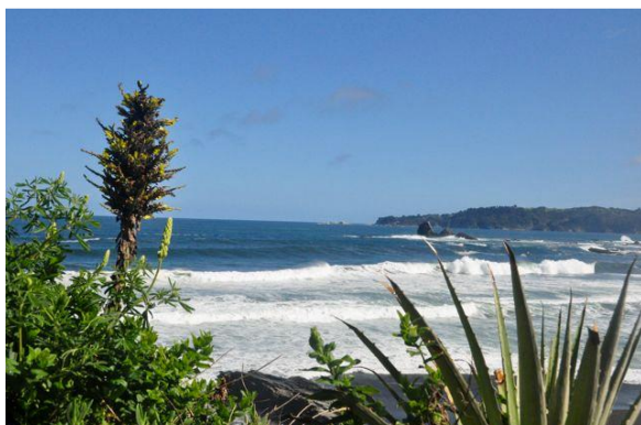
Im Nationalpark Bio Bio

Am nächsten Tag besichtigten wir zunächst die Stadt und die Universidad de Concepción, die zu den bedeutendsten des Landes gehört. Unsere Gastgeber fuhren im Anschluss mit uns an einen wunderschönen urwüchsigen Strand in einem Nationalpark nahe Concepción, wo wir ein wenig Zeit hatten, einfach nur dem Meeresrauschen zu lauschen, ein paar Schritte zu gehen und die Ruhe zu genießen. Man konnte sich kaum vorstellen, dass hier der Anlaufpunkt für die ersten Hilfslieferungen für die Region um Concepción direkt nach dem Erdbeben war, da alle Brücken und Zufahrtsstraßen zerstört waren.