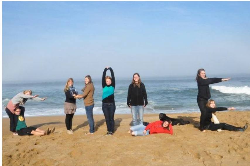
Der Landesjugendchor Brandenburg am Pazifik in CHILE

Nach einem kleinen frühmorgendlichen musikalischen Abschied für den deutschen Direktor und die Kleinsten der Schule, fuhren wir zunächst zum Strand, wo sich die ganz mutigen noch ins eisige Wasser des Humboldtstroms stürzten. Danach machten wir uns auf den Weg nach Concepción, der zweitgrößten Stadt Chiles, die wir nach circa 7-stündiger Fahrt erreichten und auch dort wieder von unseren Gastgeberfamilien der deutschen Gemeinde freundlich empfangen wurden.