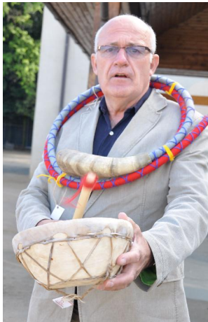
Ein Dankeschön der dt. Schule in Temuco – keine Blumen sondern Mapuche-Instrumente

die Nähe des Vulkans Llaima im Nationalpark Conguillío, einer der höchsten und aktivsten Vulkane Chiles, leider war er im Nebel nicht zu sehen. Nach dem Abendessen in Temuco ging es dann mit dem Bus 12 Stunden über Nacht zurück nach Santiago, von wo aus wir uns am nächsten Morgen auf die lange Heimreise machten. Am Abend des 3. Oktober erreichten wir zwar etwas übermüdet, aber noch erfüllt von Musik, wunderschönen Eindrücken und netten Menschen, Berlin.