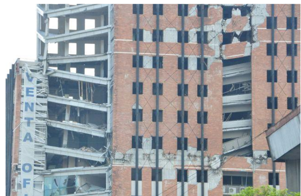
Erdbebenschäden in Concepción