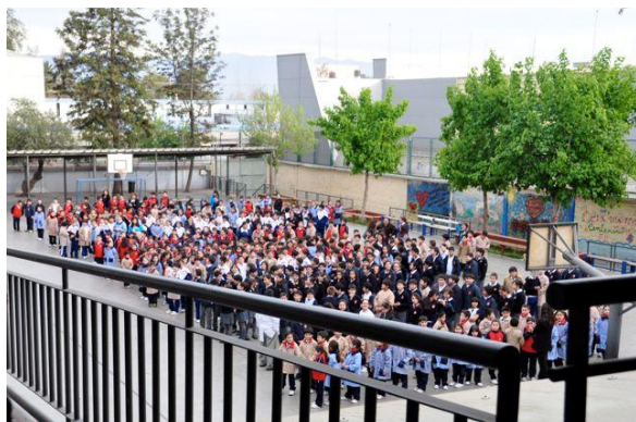
Musikalischer Empfang für uns in der dt. Schule von Los Andes

war. Der anschließende Abend wurde individuell mit den Gastfamilien verbracht, und wir trafen uns früh morgens am folgenden Tag in einer deutschen katholischen Privatschule von Los Andes wieder. Dort gaben wir nach einer Führung durch die Schule vor rund 350 Schülern ein didaktisches Konzert, in dem wir die Musikstile in der Chormusik der einzelnen Epochen vorstellten.